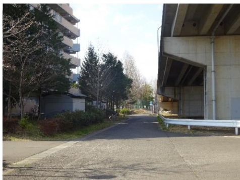
① 千間堀踏切付近通学路