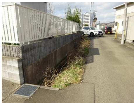
② 新町1丁目地内(159号線脇)