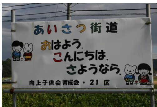
育成会活動スローガン