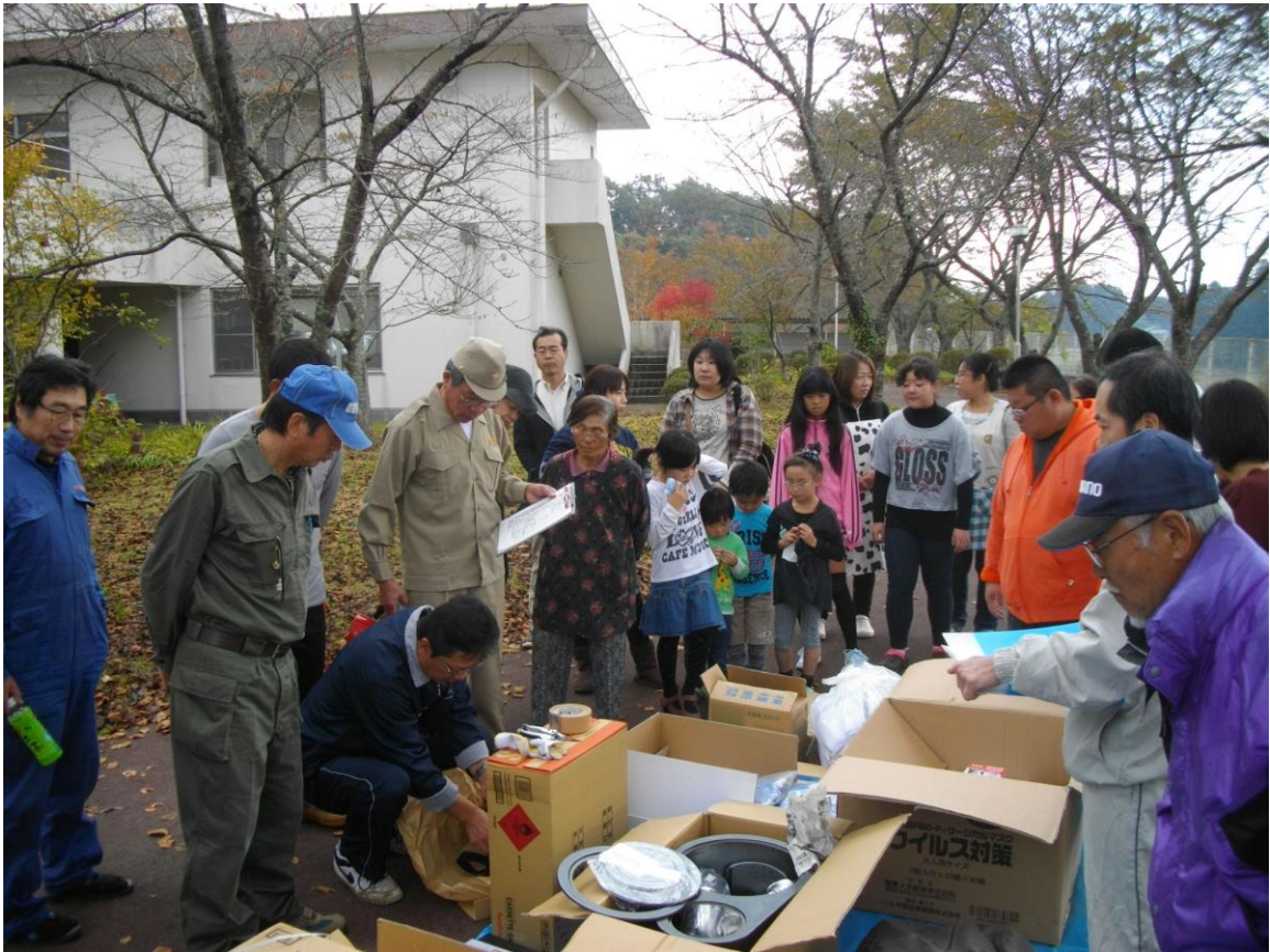
(防災倉庫点検活動の一コマ)