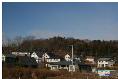
新興住宅「ゆずが丘」