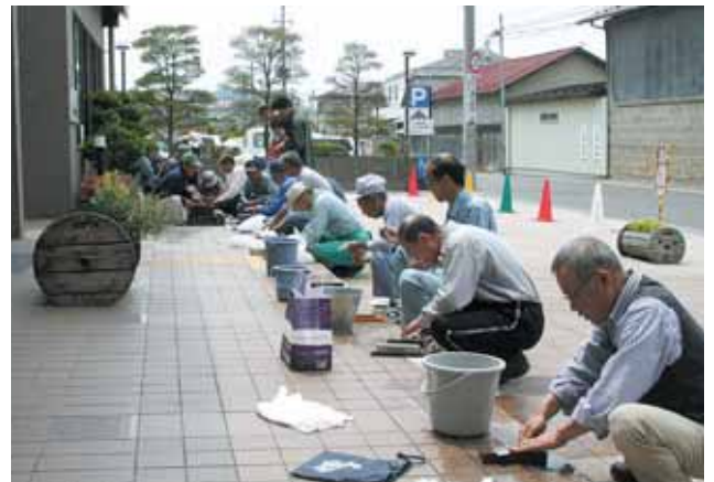
とっちゃんは何でも一生懸命

家庭で生活用品の整備や補修などを頼まれることの多い父親たちが技術を学ぶ「とっちゃんの技磨き」が5月27日、槻木生涯学習センターで行なわれ20人が参加しました。今回の学習テーマは「刃物を研ぐ技を身につけよう」でシルバー人材センターの方の指導のもと、実際に砥石で包丁などを研いでみました。父親の頼もしさを家族に示す絶好の機会になりました。