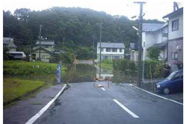
大住町地区の冠水状況

この地域は近年宅地開発が進み、これまで貯留機能を果たしていた農地などが減少したため短時間で水路に雨水が流入することになり、既設の排水路では流下断面が不足し、大雨時には道路や低地部が冠水するなどの被害が発生し住民の皆さんにご迷惑をお掛けしています。このため、大雨時には排水ポンプを設置し、強制排水を行ってきたところです。しかし、水路改修の抜本的対策までは時間を要しますことから、今後も速やかに排水ポンプなどにより減災に努めてまいります。