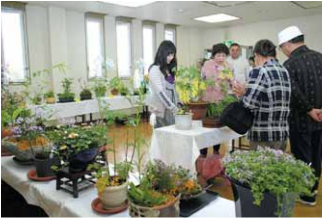
花々が色鮮やかに咲き誇る

5月22日から24日の3日間、船岡駅コミュニティプラザで「初夏の野草展」が行われました。会場には、柴田町野草愛好会の皆さんが育てたエビネやウチヨウラン、セッコクなど約100点を展示。初夏のイメージで涼しく見られるよう工夫した作品など素朴で愛らしい草花が訪れた愛好者の目を楽しませていました。同会では、初秋の野草を集めた展示会も開催する予定です。