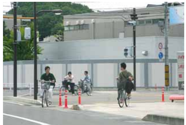
エコと健康で見直されている自転車

自転車は車道の左端か自転車専用道路や歩道（歩道に歩行者と自転車が表示している規制看板のある歩道）を走行することになっています。ご提案のように自転車専用道路があれば、自転車をご利用される方は便利かと思います。それには歩行者と自転車が余裕を持って通行できる幅員の整備や公共施設、ショッピングセンターなど人が集まる場所を接続するネットワークを計画する必要があります。将来の健康や環境を考えれば自転車や歩行者の交通網の整備が重要ですので、将来のまちづくりの一考として、提案を受け止めたいと思います。