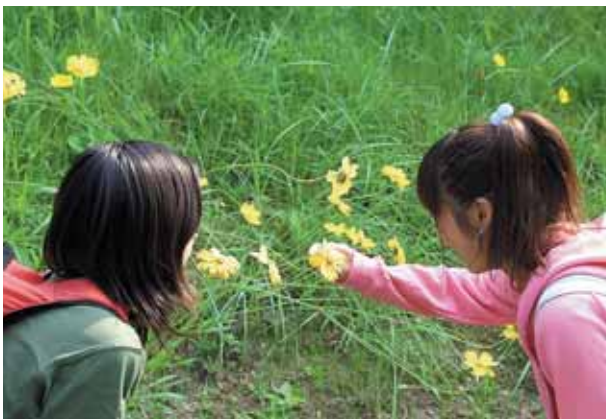
地域の身近な相談員として 生活をサポートしています

町としても、高齢者、障害者などへの見守り・相談・支援や課題を抱える子ども・子育て家庭への支援と虐待防止、また、災害時要援護者の支援など、民生委員児童委員の活動に大いに期待しています。