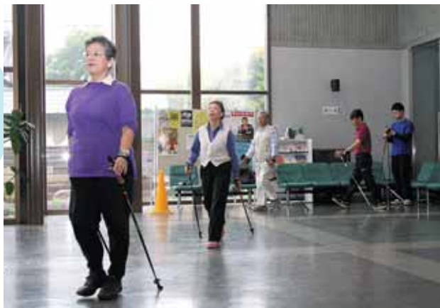
正しい姿勢でウォーキング