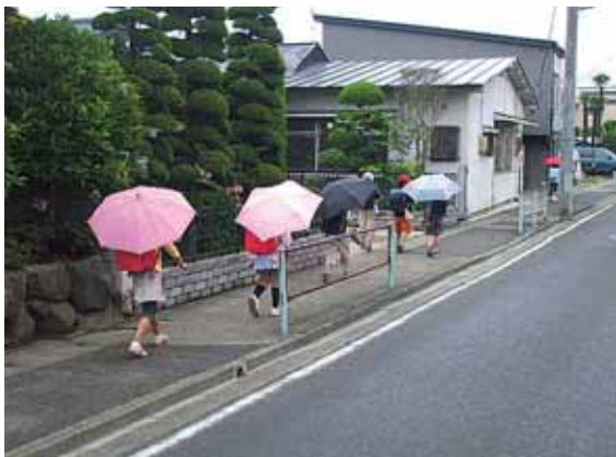
通学路の安全に努めています

町では、将来予想される宮城県沖地震に備え、平成15年度からスクールゾーン内の通学路に面する危険ブロック塀などについて、補助金を出して除却してもらう事業を実施しています。ブロック塀などは個人所有のため、所有者との話し合いも必要であり、町で事業の趣旨を説明しご了解をいただいた上で、平成20年度までに町内69カ所の危険ブロック塀の除却を行っていただきました。今年度も宮城県大河原土木事務所と共にパトロールを実施して、危険ブロック塀の除却要請をいたしました。