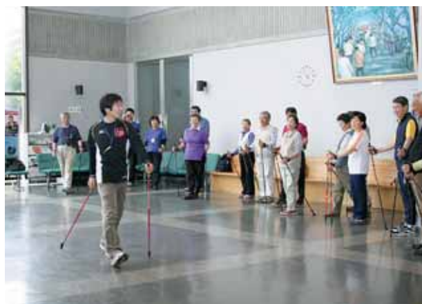
ボールの使い方のコツを学ぶ