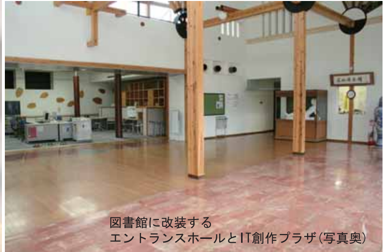
図書館に改装する エントランスホールとIT創作プラザ(写真奥)

船岡城址公園のふもと、ふるさと文化伝承館、資料展示館思源閣、産業展示館、如心庵(茶室)、齊藤博記念文庫で構成する町の文化施設「しばたの郷土館」。図書館は、ふるさと文化伝承館内の1階エントランスホールとIT創作プラザを改装して設置します。