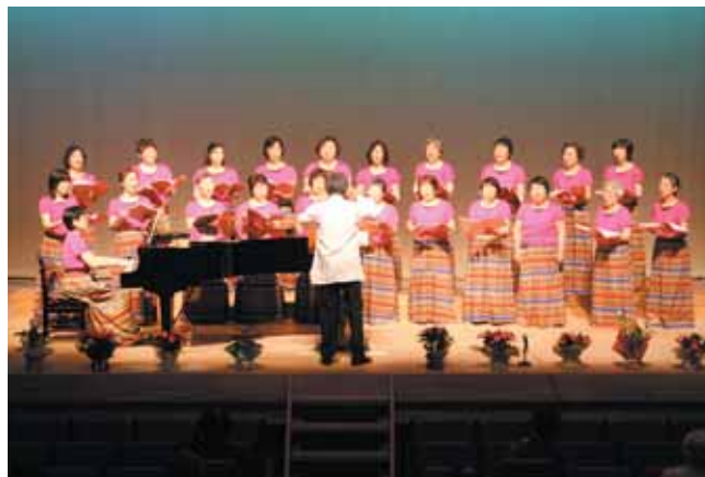
美しいハーモニーが会場を包みました

つきのき女声コーラスの結成35周年を記念したコンサートが6月7日、槻木生涯学習センターで開催されました。このコーラスは、女性21人で構成されていて、月4回の練習を重ねコンサートに臨みました。「からたちの花」や「初恋」など18曲を熱唱し、会場の観客から大きな拍手が送られました。これからも、地域に根ざした活動を継続して行なっていきます。現在、団員募集中です。