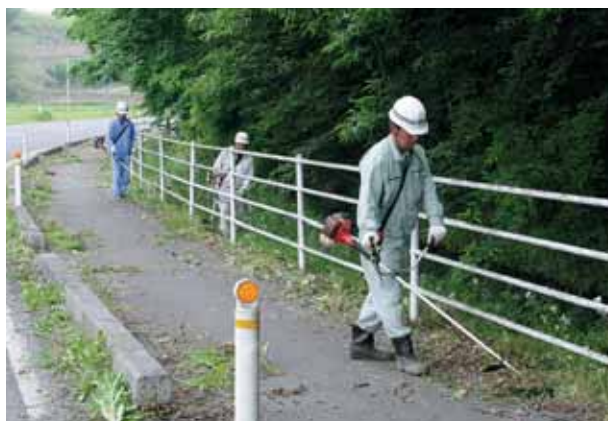
職員も河川敷、堤防、道路、公園などの草刈りを行っています

町では、各地区にある街区公園の維持管理を、その地区で構成する公園愛護協力会に委託し、公園の草刈り・清掃、また、季節の花々を植えていただいで環境美化に努めています。さて、草刈り機械の貸し出しですが、広い公園の草刈りには家庭用の草刈鎌よりも「肩掛け式草刈り機」や「手押し式草刈り機」のほうが効率よく細かくすることができ、刈り草は集草、搬出することなく場内にそのまま自然に帰することも可能であり、労力削減が図られると思います。町でも、これらの草刈り機を所有していますので、使用日時をあらかじめ連絡いただければ、貸し出しは可能ですのでご活用ください。