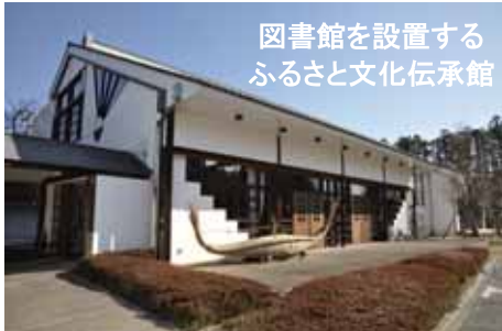
図書館を設置する ふるさと文化伝承館

平成22年度オープンをめざし、柴田町初の図書館設置に向けた準備作業がまもなく始まります。まさしく第一歩(ワン・ステップ)。準備作業は教育委員会生涯学習課職員のみならず、住民有志のボランティアを募り、協働で作業を進めていきます。今後このページで定期的に図書館立ち上げに向けた取り組みを情報発信していきます。