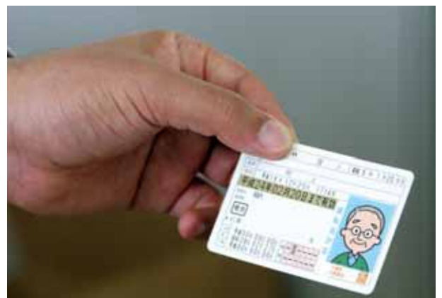
運転免許証を返納する勇気

運転免許の自主返納制度は、身体機能や判断力の低下などで安全な運転に支障があるとして、もう自動車などを運転しない方が自主的に返納する制度です。返納手続きは無料です。返納方法は、すべての運転資格返納と資格の一部だけを返納する方法があります。他の自治体では、自主返納した高齢者の方にバス運賃の割引など独自の支援をしているところもあるようですが、今のところ当町では考えておりません。また、大河原地区交通安全協会では、65歳以上の会員に限り運転免許証を自主返納された方に、運転経歴証明書（半年間、公的な身分証明書となる）の申請手数料（1,000円）を助成することとしています。