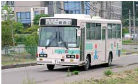
地域の足として利用されている 岩沼市の市民バス

町内循環バスなど、地域の公共交通の在り方については、重要な課題として取り組んでいかなければならないと考えています。これからは高齢者の増加に伴い、ご自身で自動車を運転されない方の生活の足として、また、趣味やサークル活動の手助けとなるよう、地域の実態に即した循環バスなどの公共交通の確保について、改めて検討していく必要があると認識しています。以前は、町内においてもバス路線がありましたが、自動車の普及で利用者が減少し、独立採算の維持が困難になり、バス路線の廃止につながった経緯があります。ここ最近、独自に公共交通に取り組む自治体が増えてきておりますが、思ったほど利用されていない面も散見されます。町としては、町内循環バスや乗合タクシーなど、各地域の特性に配慮した公共交通計画を住民の方々と協議し、町の財政事情を考えながら、実際の公共交通サービスの供給の可能性を検討していきます。