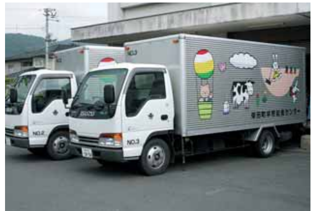
安全でおいしい給食を 届けています

町の学校給食センターは、昭和56年に使用を開始した共同調理施設で、町内6小学校と3中学校に約3,500食の給食を提供しています。現在の設備や調理器具を含め、食物アレルギーに対応できない状況にあります。当面のアレルギー対応としては、牛乳のみ停止16人、また、原材料を示した献立表の配布を実施しているところです。現在の施設にアレルギー対応のための器材・設備などを整えるには多額の費用が必要となることから、今すぐには困難ですが、できるだけ早く対応できるよう検討します。