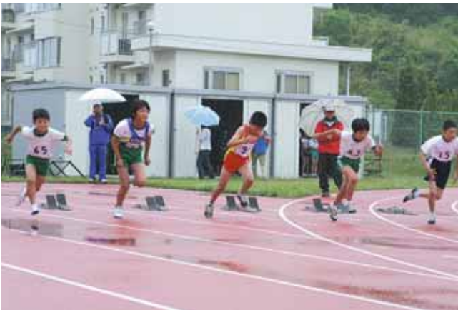
スタートも決まり一気にゴールまで駆け抜けました

5月30日、仙台大学陸上競技場で「第25回全国小学生陸上競技交流大会柴田郡予選会」が行われました。当日は、小雨模様のコンディションにもかかわらず、各校の代表選手約200人が参加し、全国大会の切符を目指して日ごろの練習の成果を競い合いました。また会場には、先生や保護者の皆さんが応援に駆け付け、選手たちに「頑張れ」「気合だ」などと大きな声援を送っていました。