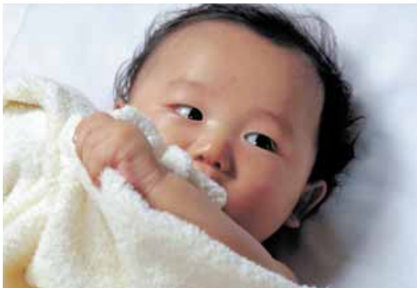
健やかな成長のため 手厚い助成が期待されます

当町といたしましても、乳幼児医療費助成は子育て支援の重要施策の一つとして捉えており、外来の助成を平成21年10月から5歳未満児まで対象年齢を引き上げることにしており、今後は、義務教育就学前まで対象年齢を拡大する方向で考えています。ご理解をお願いします。