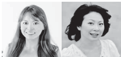
神谷末穂 (ヴァイオリン)