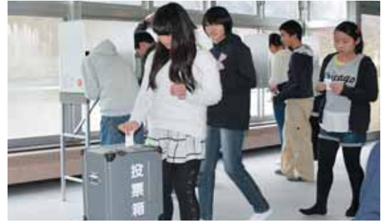
少し緊張した模擬投票

に気付かされました。今後は、地区の防災部と婦人防火クラブで地区の防災意識を高めたい」と話されました。