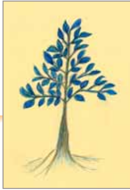
はなちゃん (ペンネーム)