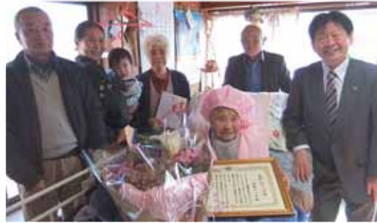
ご家族の皆さんに囲まれ、笑顔のやすをさん(写真中央)