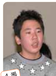
4番 米倉 命 議員