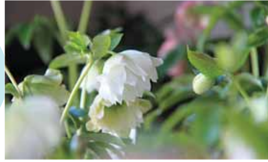
うつむき加減に咲きます