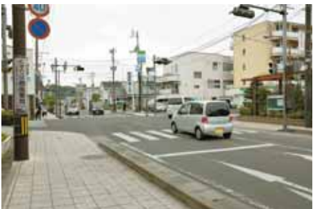
船岡駅前に設置されている歩車分離式信号機

ろ、現在、通行量調査などを行っており、歩行者の安全を確保しつつ、できるだけ渋滞緩和に向けて対応していくとのことでした。