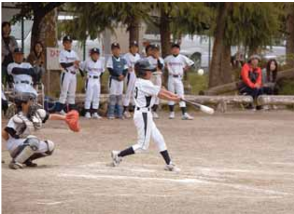
チーム一丸となって相手チームと対戦しました。

5月9日(土)、柴田町総合運動場多目的グラウンドと船岡小学校グラウンドで柴田町長杯・ヤングスポーツ旗争奪第34回仙南地区学童野球大会が開催され、仙南地区の14チームが試合に望みました。