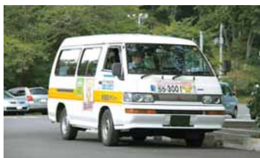
運行開始から3年目を迎える「はなみちゃんGO」

与える影響も大きいものと考えられることから、困難な状況です。ご理解をいただきたいと思います。