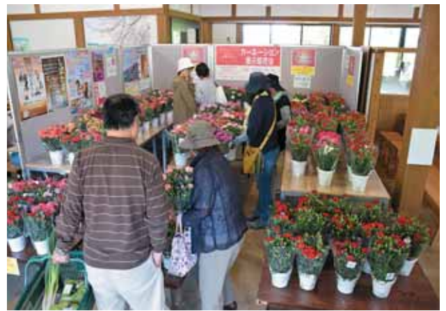
町内外からたくさんのお客様が訪れました。

母の日前の5月8日(金)から10日(日)の3日間、柴田鉢花研究会の会員が丹精込めて育てたカーネーションの展示即売会が観光物産交流館「さくらの里」で開催されました。