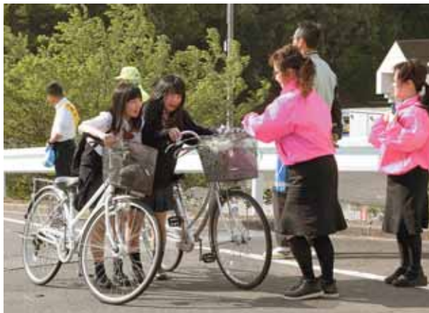
自転車利用者へ交通マナーを呼びかけ