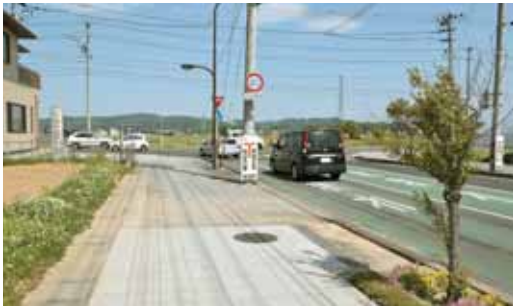
新栄通線から東船岡駅方面を望む

土地区画整理事業として東船岡駅西側の開発構想がありました。現在は計画されていません。なお、新栄通線については、東船岡駅までの延伸を進めたいと考えています。