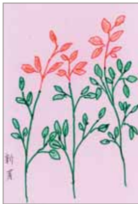
はなちゃん (ペンネーム)