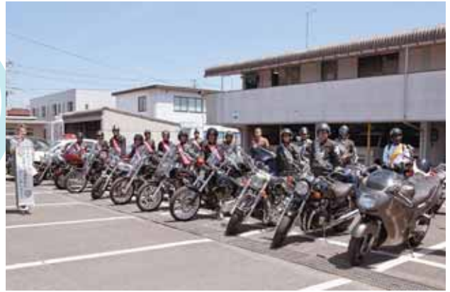
ハーレーダビットソン 20 台による 交通安全を訴えるパレード