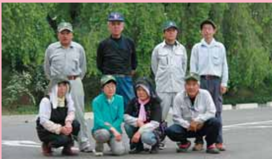
(公社)柴田町シルバー人材センターの皆さん

「スロープカー山頂乗り場から山頂に向かう園路や観光物産交流館前駐車場から降りた谷間など、館山の至る所でアジサイが咲き、見ごたえがあります。アジサイの植樹、剪定や移植などをがんばってきました。これからも来場された皆さんに喜んでいただけるようにアジサイを育てていきます」