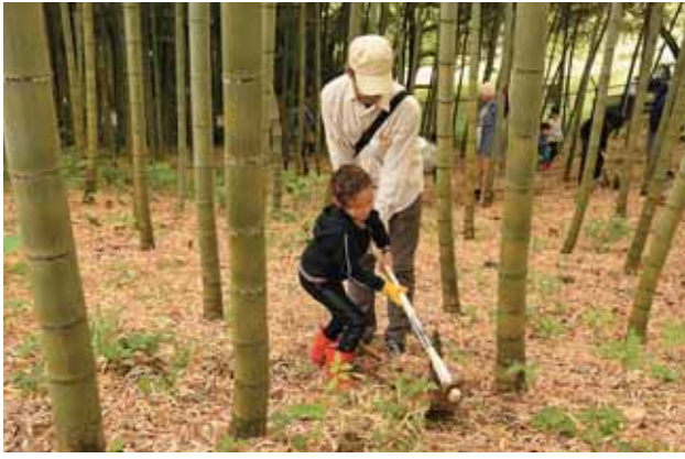
お父さんと一緒に。 きれいに根っこから取れました。

春の味覚であるたけのこの収穫を親子で体験してもらおうと5月9日(土)、柴田町太陽の村で「たけのこ掘り体験」が行われました。親子10組総勢33人が参加し、土にふれあいながらたけのこ掘りを満喫しました。