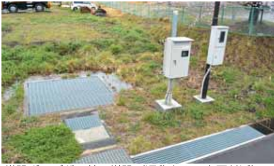
常設ポンプが3基に増設（通称もみのき園付近）

また、畑中踏切ポンプ場に8インチの常設型のポンプを設置する。船岡地区は、船岡西に1基常設型のポンプを増設する。もう1カ所、大住地区に8インチの常設型ポンプを1基増設する。