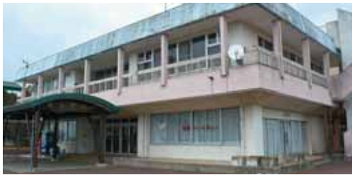
はらから福祉会のレストランが入る太陽の村旧館

答弁 はらから福祉会が太陽の村の旧館を改修し、石釜ピザや牛タンを提供するレストランを開業する。その支援に充てる。