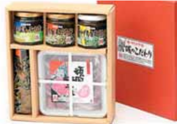
柴田町の返礼品の1例 (つけものセット)