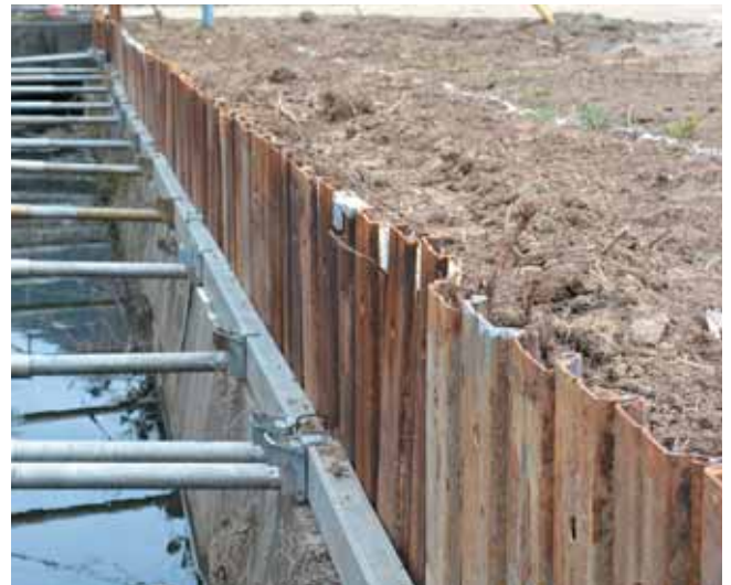
鷺沼5号調整池の矢板工事

答弁 次年度に契約する予定であったが、進み具合で、前倒しして進めることになった。1億6千922万円の増額になる。