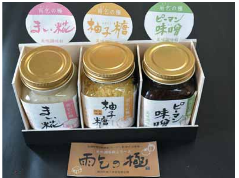
商品開発中 雨乞の極

質疑 ふるさと納税1億 円を目指して商品開発を 進めては。 答弁 返礼品は同じもの だけではあきらまれる。予 定している商品として、 商工会女性部で商品開発 をしているものや、陶芸 品を加える。今後とも知恵 を出し合い進めていく。