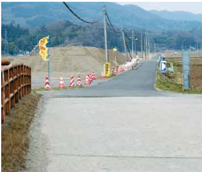
完成が待たれる町道富沢16号線

3月11日に予算審査特別委員会を設置しました。平成28年度の一般会計、特別会計及び水道事業会計について審議し、3月16日に終了しました。質疑内容の一部を紹介します。