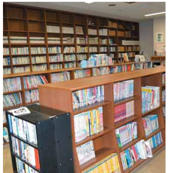
司書が配置される図書館分室（槻木生涯学習センター）