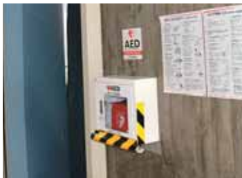
すでに設置されている槻木小学校

答弁 各小中学校の体育館にAEDを設置するため。ただし、体育館と校舎が一体化になっている。槻木小学校は除いている。