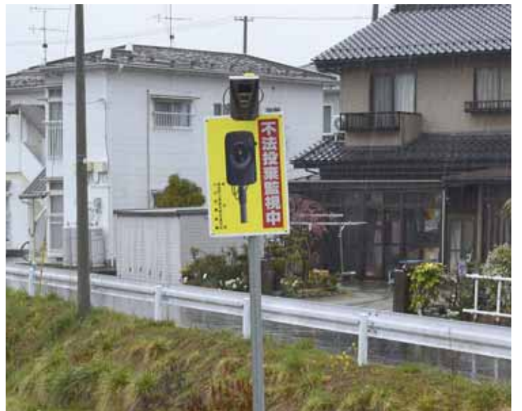
監視カメラで不法投棄の未然防止

るので、9台となる。その9台を配置しながら防止対策に努める。 質疑 不法投棄の映像で違反者を確認できた場合は。 答弁 あくまでも未然防止に努めるが、悪質な事例があれば、警察に問い合わせる。