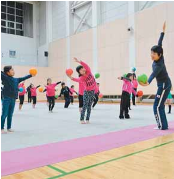
元オリンピック選手秋山エリカ氏による新体操教室