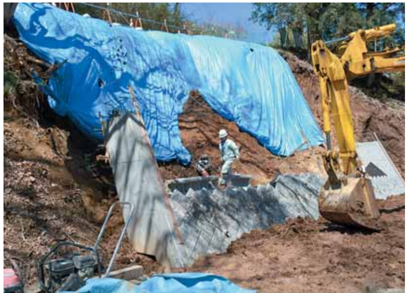
復旧工事が進む入間田関本地区

【質疑】 先送り事業の内容は。 【答弁】 財政分野では、公共施設の台帳整備を委託しているが、想定より膨大な情報量になり、もう少し整理に時間がかかるために繰り越す。 榎木中学校体育館の改