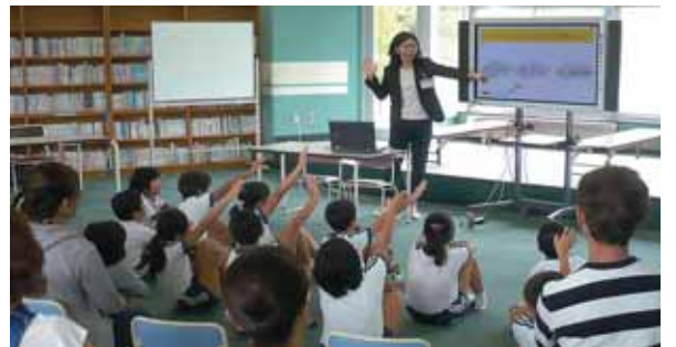
小さなうちからたばこの害について知ることも重要です。

子どもの誕生を機に、たばこについて考えました。それまで吸っていた家族もやめています。外ではまだ仕切られていない喫煙所がたくさんあり、知らない内に煙を吸ってしまっているかもしれないと、心配になります。受動喫煙にならないようにしっかりと分けて、吸う人も吸わない人もお互い気持ちよく過ごせればと思います。