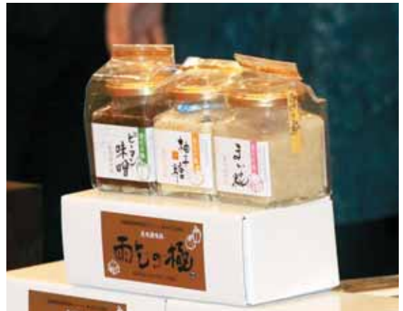
彩りのある3品がお披露目されました。

町の新たな特産品として「雨乞の極」が完成しました。柴田町商工会女性部が2年かけて開発した企画商品で、「ピーマン味噌」、「柚子糖」、「まい麴」の3品。雨乞地区で育てられた素材を生かして作られた美味調味料です。 完成した商品のお披露目会が1月23日(月)、町内のホテルで開催され、経過報告や試食などがありました。 「このピーマン味噌はご飯にとっても合う」などとても好評で、そのまま使ってもよし、料理に使ってもよしの「雨乞の極」。今後に期待しています。