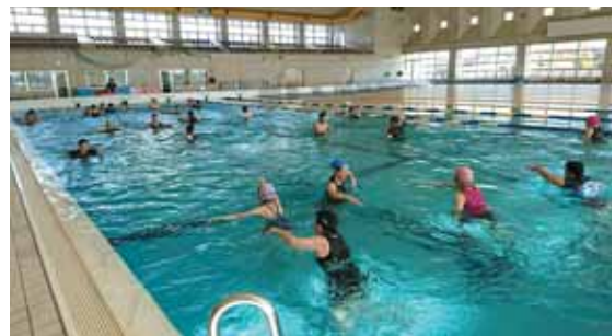
1歩1歩大きく歩くとより効果的です

※会員を募集しています。会員になると、さまざまな特典があります。詳しくは事務局までお問い合わせください。