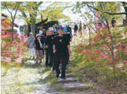
花に囲まれながらウォーキング！

「スマイルウォーキング」をモットーに毎週コースを決めて季節の移ろいを楽しみながら歩いています。人が集まることで、柴田町の植栽活動に参加するなど、サークル以外の新しい活動にもつながりました。介護予防のために始まったサークルですが、今では人や地域とのつながりが強くなったと感じています。