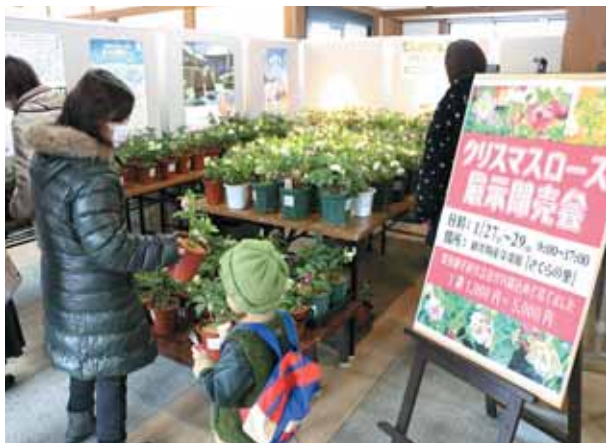
クリスマスローズは冬の貴婦人と呼ばれています。