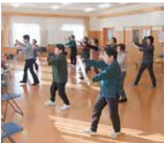
ダンベル以外にもダンスや体操など、さまざまな運動をします。

私たちは「楽しく」をテーマに10年ほど活動しています。楽しみながらの活動が、いつの間にか地域のつながりを強くしていったと実感しています。