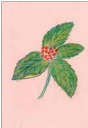
はなちゃん (ペンネーム)

ふれあいマイタウンは、町民の皆さんからの応募・紹介でつくるコーナーです。俳句・川柳・短歌に興味がある（こうほう文芸）を載せたいという方は、はがきなどで3月9日（木）までご応募ください。