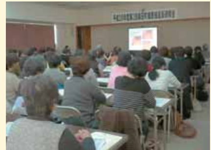
がん検診の大切さを再認識する健康推進員の皆さん