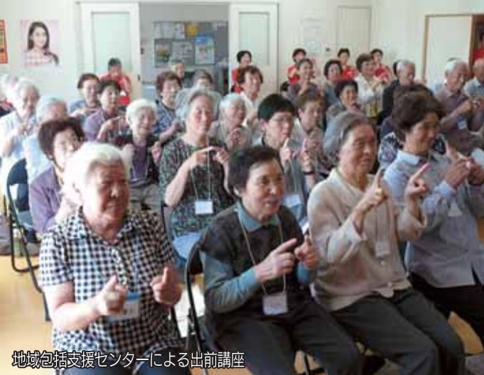
地域包括支援センターによる出前講座