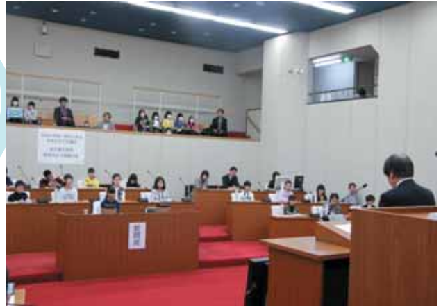
町議会さながらの雰囲気です。議事進行されました。