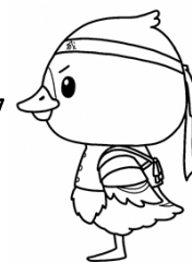
みやぎハローワークキャラクター 「カンちょーさん」