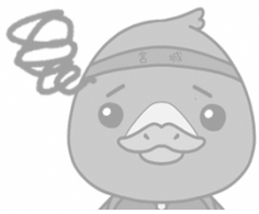
みやぎハローワークキャラクター ガンちょーさん