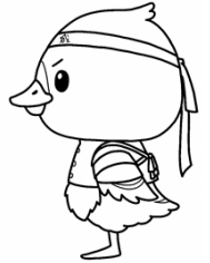
みやぎハローワークキャラクター 「カンちょーさん」