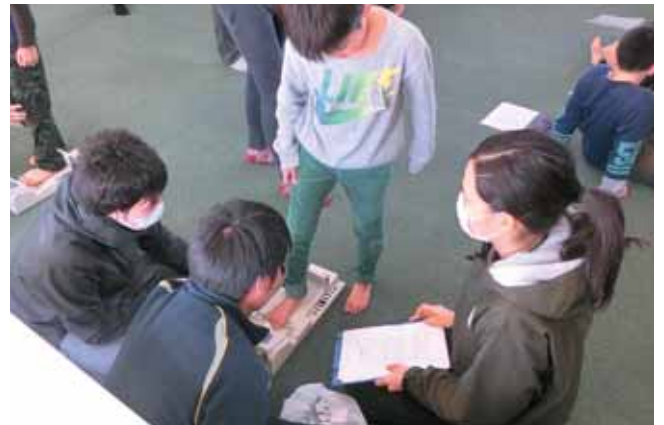
ぐぐっと、足指測定中!!

問 本町の29年度全国体力テスト（対象は小学5年生、中学2年生）の結果はどうだったのか。 教育長 29年度の本町全体の体力合計点（8種目）は、まだ公表されていない。28年度の結果では、小学5年生男子、女子とも県の平均を上回り、国の平均と同程度だった。中学2年生では、男子は県の平均と国の平均を回り、女子は県の平均と国の平均を上回っている。