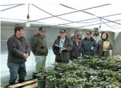
町内花き生産農家