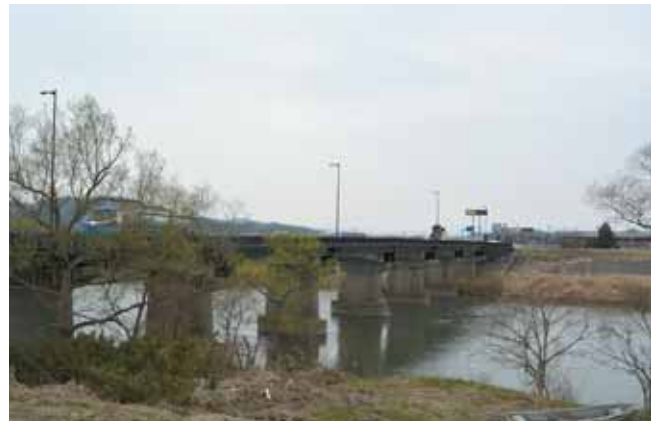
平成26年に耐震補強工事された白幡橋

問 古い橋を順番に5つ挙げてほしい。 町長 昭和25年建設の上名生字中川地内の久根添4号橋、中名生字西洞明田地内の船岡五間堀4号橋、船迫字釜ヶ入地内の平堀5号橋、昭和28年