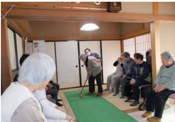
気分もスカット！ スカッドボール!!