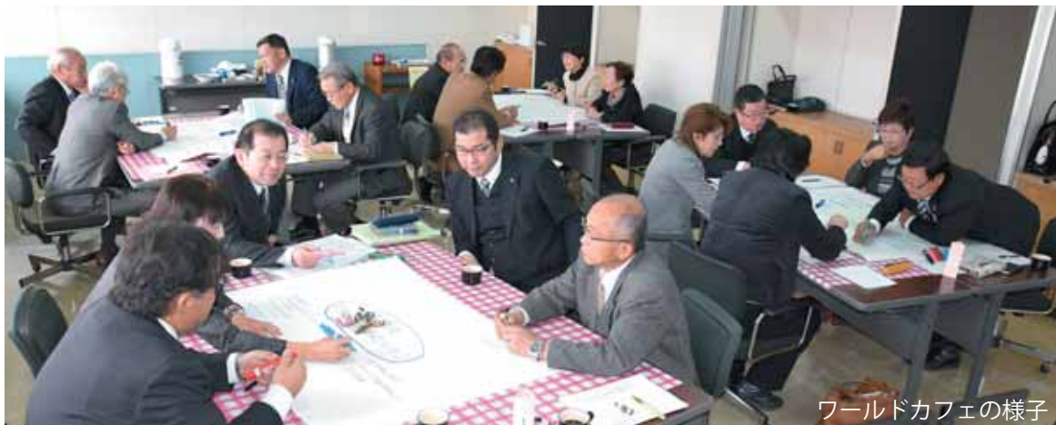
ワールドカフェの様子

総合体育館建設 体育館建設利用計画、見込みについて ●利用者数の予測は。●各種イベントなど利用計画は。体育館の規模 ●広さの根拠は。 体育館建設に要する予算について ●全体の総額は。●予算が33億を超えた場合、縮小するのか。 建設時期について ●建設時期を2～3年延長し、その分を目的基金に積み立てては。 財政負担 将来を見据えた全体的なシミュレーションは。 住民意向 体育館がほしい声、利用しない声をどうくみとるか。 その他 防災機能は。トッコン跡地の利用は。町全体の負債総額は。