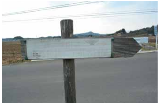
老朽化した案内板

問 里山ハイキングやフットパスで訪れた方が、場所によっては迷うこともある。地域の人が案内することもあるが、道行く人にわかりやすいサインがあれば、町長の掲げる交流人口の増加やつながり人口の増加にも対応できるのでは。 町長 里山ハイキングコースは、現在6コースあり、利用頻度の高い「深山コース」から案内板を更新する。材質やデザインについては、フット