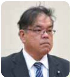
広沢 真 議員