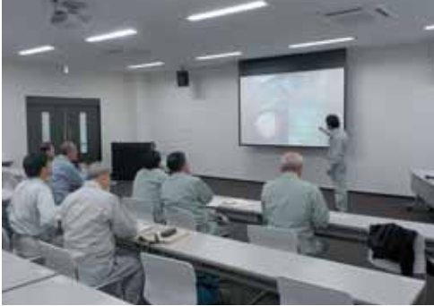
仙南クリーンセンター