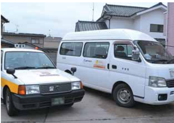
町内で活躍するデマンド型乗合タクシー

デマンド型乗合タクシーでは、「みやぎ県南中核病院まで行けない。到着時間が読めない」など、改善を求められる声がある。 問 時間どおりの運行には、中央部での循環型プラス周辺部のオンデマンド型が適しているが、 まちづくり政策課長 角田市の場合は、東西南北と4つのエリアから町なかに入ってくる。本町で導入した場合、町なかだけを回る利用者はいないのでないか。 問 1つの方式で本町全域をカバーするのは