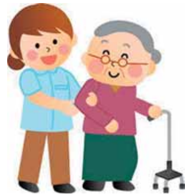
みんながサポーター

現在は、障がいのある方もない方も共に生きる社会が求められている。本町も誰もが暮らしやすい社会を目指し、新たな取り組みが必要では。 問 「あいサポート運動」をどう考えるか。 町長 地域の住民が障がいの者のサポーターになる取り組みで、鳥取県が21年に始めた。様々な障がいを知ることから始め、障がい者が日常生活で困っていることを理解し、必要な配慮や手助けを