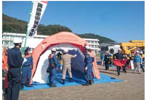
備えあれば憂いなし

災害はいつ起きるかわからない。応援をもらうだけで復旧・復興が順調に進むわけではなく、いざというときのために応援を有効に活用できる体制づくりが重要である。 総務省の26年度報告では受援計画の策定は都道府県で約4割、市町村で約1割にとどまっている。