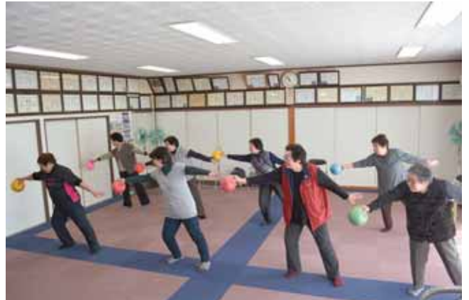
みんなで健康維持

介護予防・日常生活支援総合事業の一つとして、町社会福祉協議会に事業委託した生活支援コーディネーターの役割や、今後の方向について問う。