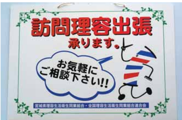
全国的に広がりをもせる訪問理美容