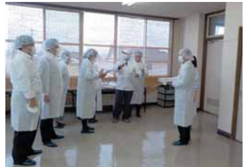
学校給食センター