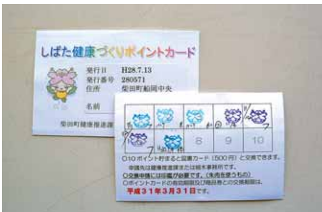
健康づくりポイントを獲得!!