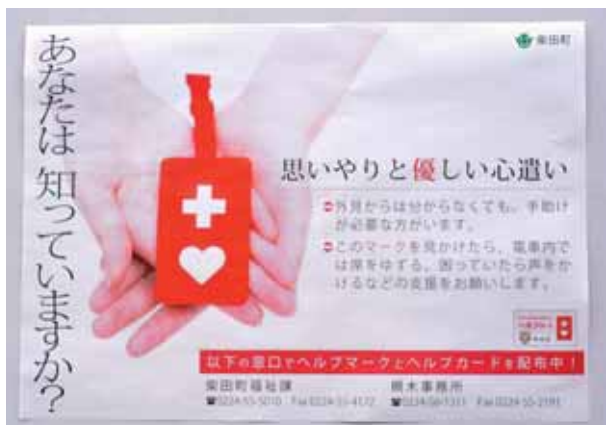
知ってほしいヘルプマークのこと

意見交換をした。広報しばた、町ホームページに記事を掲載、また、町内の公共施設や大学、駅などにポスターを掲示、民生児童委員協議会定例会などで説明した。 問 デザインは、どんな意味を込めたものか。 町長 赤は普通の状態でないことを発信し、ハートは手助けする気持ちの意味を含んでいる。助け合うことが、普通のことになっていくことを目指している。