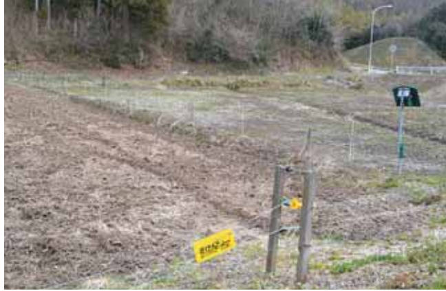
イノシシ対策の電気柵