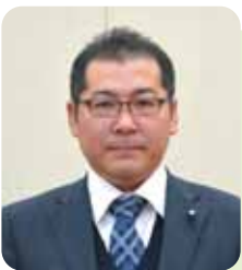
森 裕樹 議員