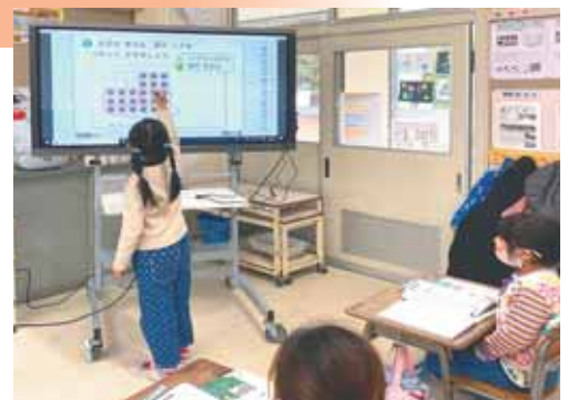
電子黒板に触れながら楽しく学べます

「拡大表示が簡単にできる」、「動画や音声の再生ができる」、「書き込みや保存ができる」などの特長があります。また、付箋紙を貼るように電子黒板上でカードを動かすことができ、児童自ら操作することができるので、学習意欲が高まり、使用機会も増えてきています。