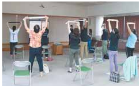
令和2年度は516人の方々に参加いただいた健康づくりポイント事業。

とになります。また、年度末には、記念品の交換申請をされた方の中から、抽選で賞品をプレゼントしますので、多くの方々にご参加いただきたいと思います。