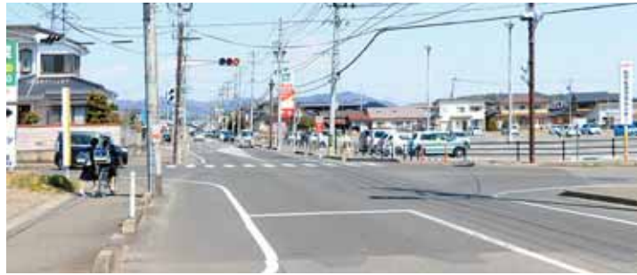
令和3年度中に四方向すべてに横断歩道が設置される予定です。