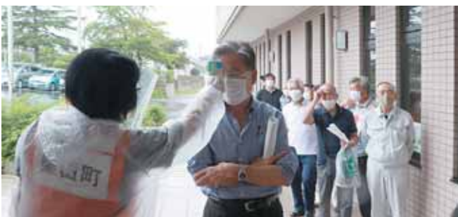
検温や避難テントの設営などを行った避難所設置訓練。

このような避難所開設訓練を実施する際には、ぜひ多くの方々に参加いただきたいと思います。