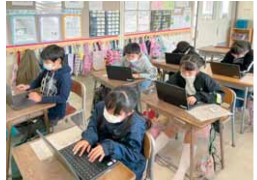
さまざまな授業でパソコンを活用しています

パソコンを活用しての授業改善は、始まったばかりですが、他校の実践例も参考にして、「確かな学力」の育成のために、研修を進めながら授業での活用を続けていきたいと思えます。