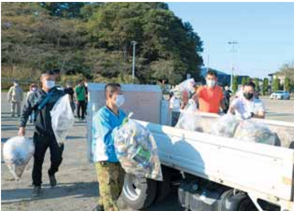
多くのごみが集まりました。

「普段から地域活動をされて いる隊友会の皆さんと一緒に、 我々が日頃からお世話になっ ている柴田町に少しでも恩返 しができればと思います」と 述べられました。