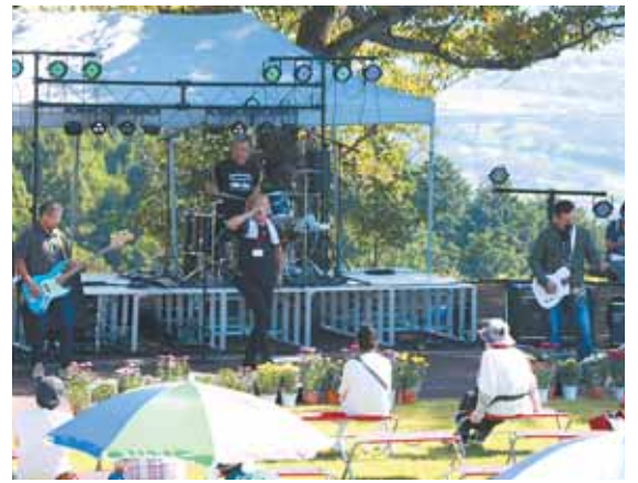
太陽の村にバンドサウンドが帰ってきました。

バンドフェスタに訪れた方 は、「天気も良く外で音楽を聴 くにはとても良い雰囲気だ した」と話してくれました。