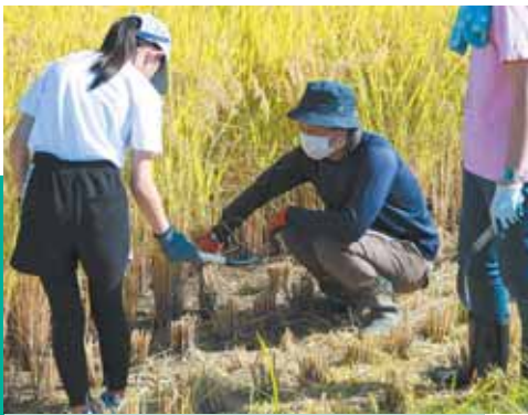
田植え、稲刈りなど多くの農業体験を開催して農業の魅力を発信。