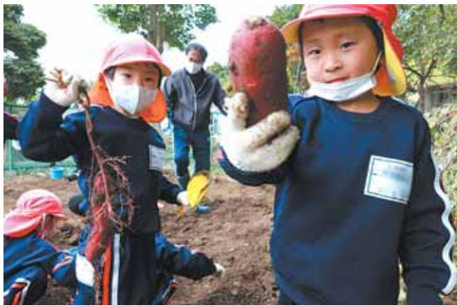
収穫したさつまいもは、焼き芋やふかし芋にして食べる予定です。