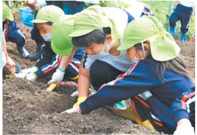
泥だらけになりながら一生懸命さつまいもを掘りました。