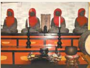
大光院所蔵の鉄造阿弥陀如来座像