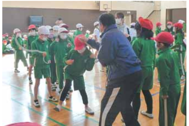
学級全員で長なわ跳びにチャレンジ

スポーツを通して仲間と協力する心を磨き、記録に挑戦し達成して喜ぶ児童や、仲間のために練習のサポートをしたり、応援したりする児童がたくさんいることが船迫小の誇りです。これからも、勉強にスポーツに、「夢に向かって」挑戦する船迫小をみんなで創っていきます。