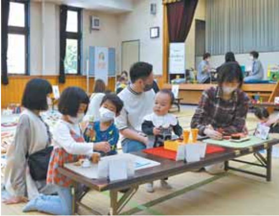
ゲット・トイに選ばれたおもちゃで遊びました。

参加された方は、「広いス ペースで自由におもちゃで 遊ぶ機会はなかなか無いの で、親子で楽しませてもら いました」と話してくれました。