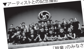
「鼓童」のみなさんと