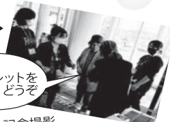
パンフレットをどうぞ