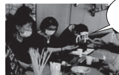
おいしいおにぎりやコーヒーをどうぞ

えずこホールでは、イベントの際にチケットのもぎりやお客様のご案内をするボランティアさんを募集中です!一緒にえずこホールのイベントを違った角度で楽しみませんか?ボランティアポイントが貯まると公演チケットと交換できます!一緒にイベントを盛り上げたい方、お待ちしております!