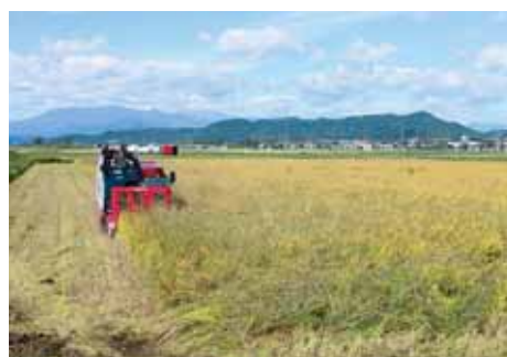
ドローン播種を行った田んぼの稲刈り