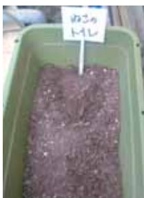
地域で設置した猫のトイレ

また、虐待、ネグレクト（世話の放棄、遺棄などは犯罪）ということを改めて理解していただきたいです。