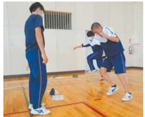
部活動でミニハードルトレーニング

体力の向上には、トレーニングだけではなく、家庭と連携しながら、規則正しい生活、食事、睡眠が大切です。生徒たちには運動を通し、体を動かす楽しさや喜び、体づくりや健康の大切さを学び、感じてほしいと考えています。