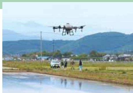
5月に行われたドローン播種の様子

町内でもスマート農業の取り組みの拡大が進み、ドローンの導入が急速に増えています。近い将来、田植え時期にドローンが飛んでいる光景が広がるかもしれません。