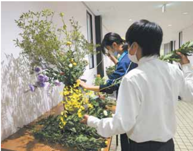
茶華道部は「全国高校生花いけバトル」上位を目指して頑張っています。