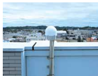
大河原合同庁舎に設置された受信機 ※半径およそ20kmをカバーできます

柴田町でもRTKを活用したスマート農業が始まっており、作業の効率化や省力化が期待されています。