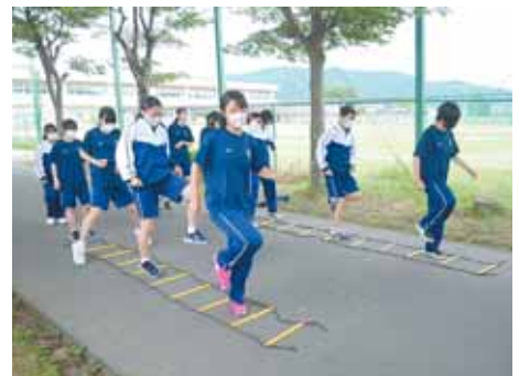
ラダーでウォーミングアップ

生徒からは「3年生になってから体の強さが増してきたように感じ、体力の向上にはやはりトレーニングの積み重ねが大切だと感じています」との声も聞いています。3年間にわたりトレーニングを継続した結果、3年生男女の体力テストの1年を通した数値の平均伸び率は、全国平均レベルに向上しました。