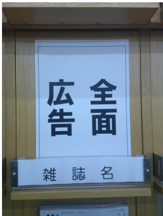
【本棚】（カバー裏面と同じ広告）