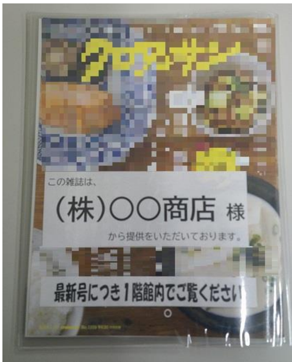
【雑誌表面】（表示は図書館が作成）