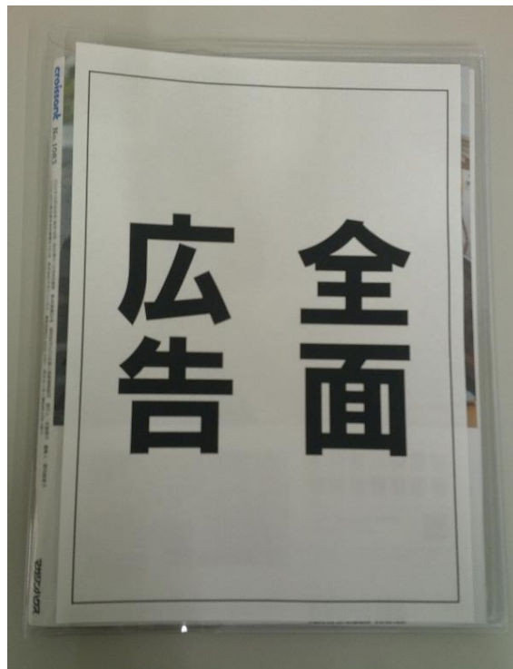
【裏面】（広告はスポンサーが作成）